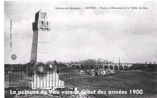
La pelouse de Vau vers le début des années 1900

Un partenariat avec un éleveur est en projet pour pâturer les pelouses calcaires.