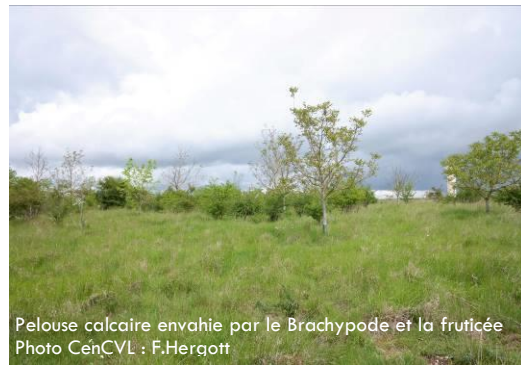
Pelouse calcaire envahie par le Brachypode et la fruticée