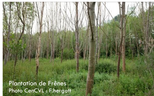
Plantation de Frênes