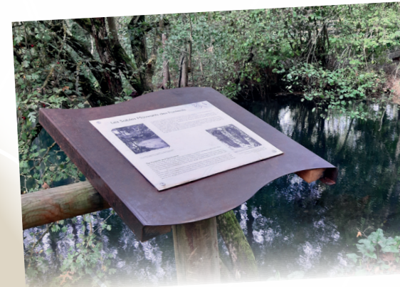
16 panneaux d'information jalonnent le chemin