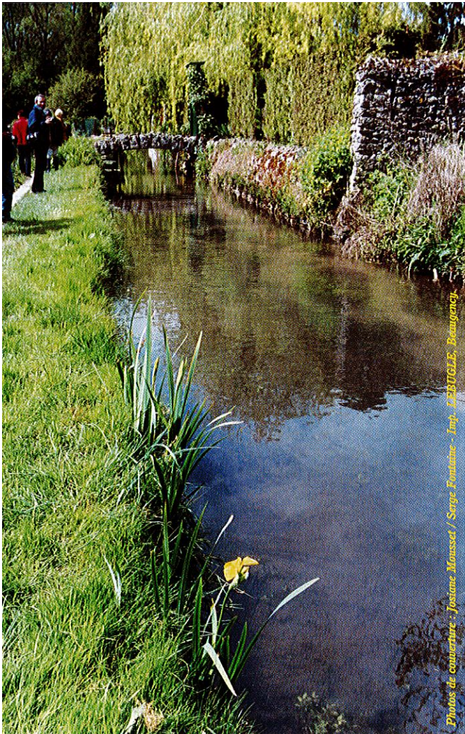
Photos de couverture : Justine Moussot / Serge Fontaine - Imp. LEBUCLE, Beaugency